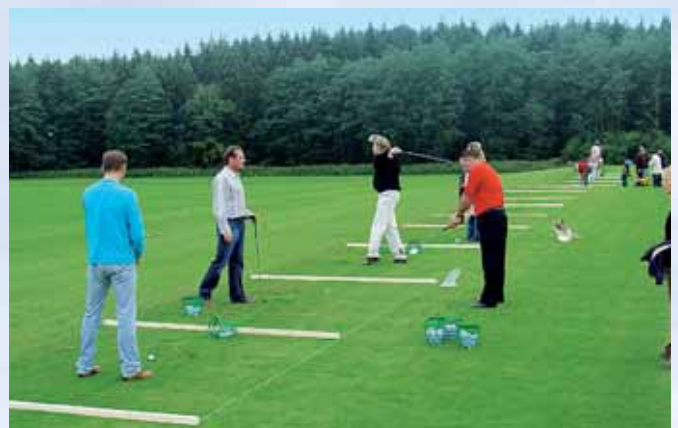
Betrieb auf der Driving Range