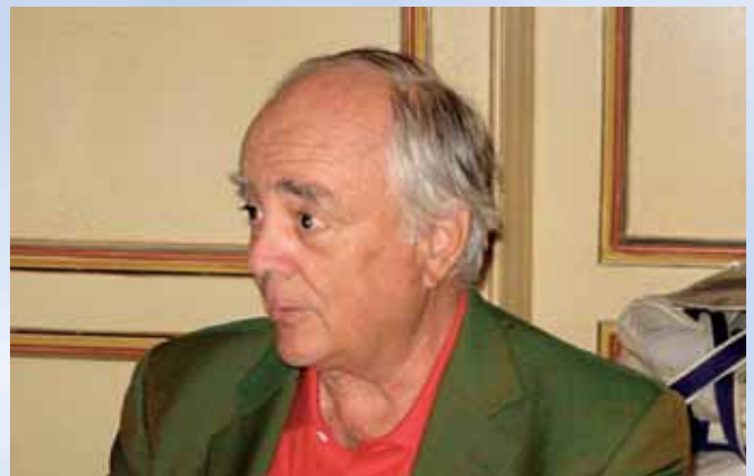
Robert Trent Jones jr.

Sehr kurze Anfahrtswege für Golfspieler aus Laupheim (4 km) und EHINGEN (8 km).