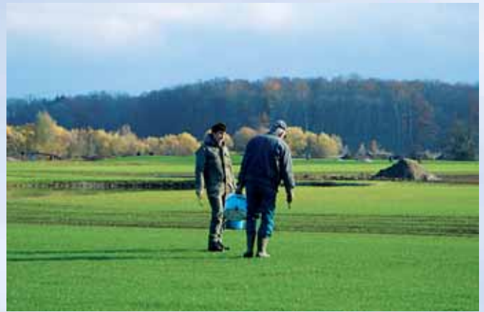
Unsere Greenkeeper im Einsatz

Für unseren Golfclub konnten wir überregional tätige Firmen gewinnen. Diese werden uns bei den Investitionskosten unterstützen. Darüber hinaus werden diese Sponsoren auch sehr interessante Turniere auf unserer Anlage ausrichten. Die Planungen für das zweite Halbjahr 2007 laufen bereits. Wir sind sicher, dass sowohl unsere Mitglieder als auch unsere Gäste von diesen Turnieren begeistert sein werden.